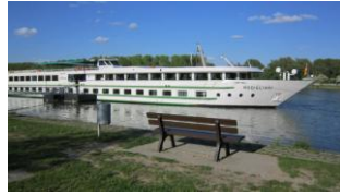
Notre bateau le Modigliani