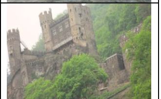
le Rhin romantique et ses châteaux féodaux