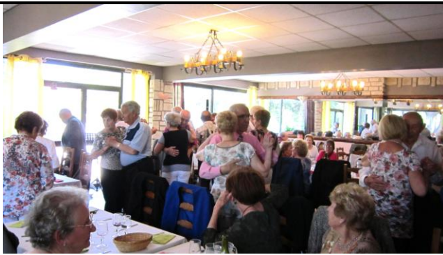
DEUX SORTIES MEMORABLES A LEVENS LE 15 MAI ET A UTELLE LE 12 JUIN On danse la Tarentelle et le Kuduro