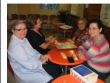
Le scrabble tout l'été