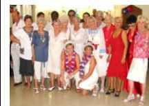
Les couleurs bleu, blanc et rouge sont de rigueur