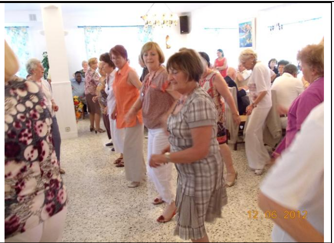
CI-DESSOUS LES NATIFS DE MAI ET DE JUIN