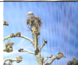
Strasbourg et ses cigognes